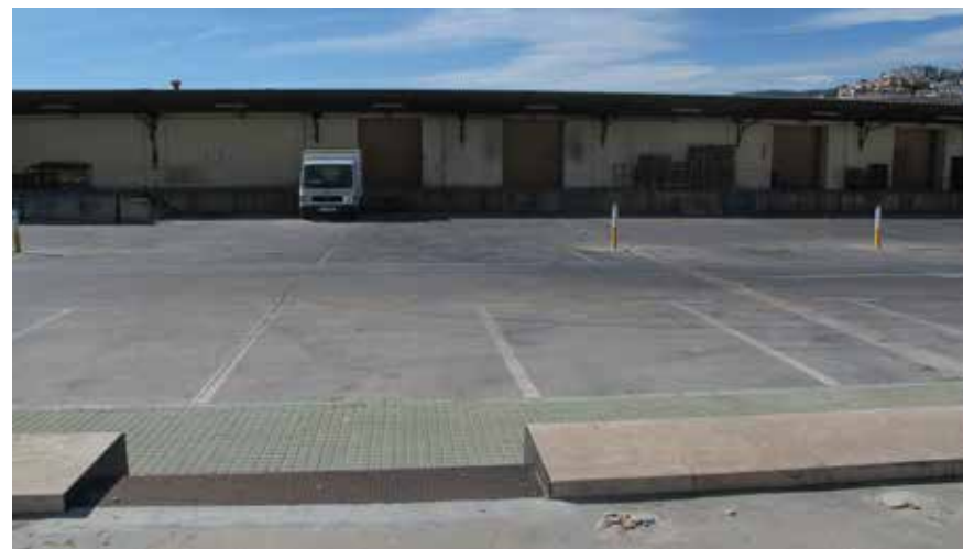
— © Christine Felten, Peniscola 2013