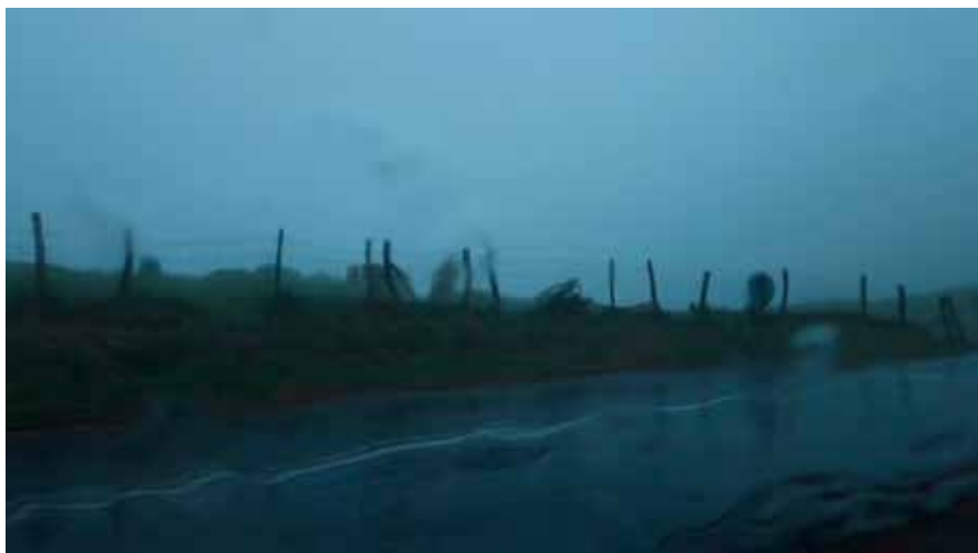
— © Christine Felten, Photogramme: Jaikibel , vidéo HD 2014: 1'46"