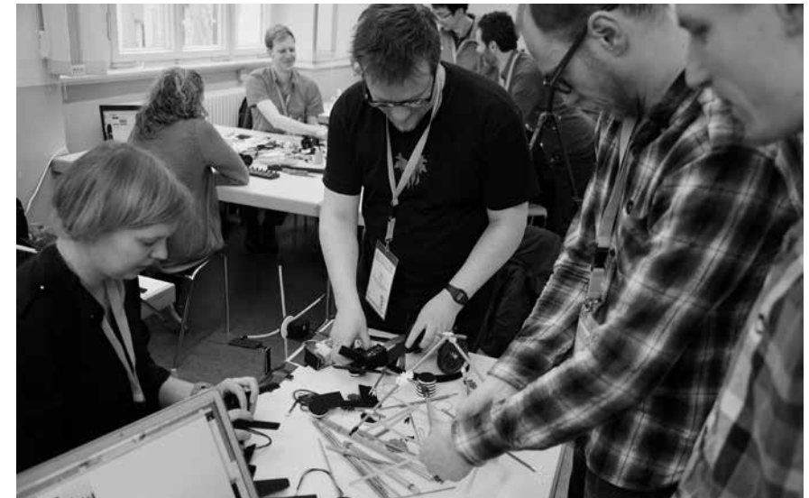
— The Misbehavior of Animated Objects Workshop 2014

Si ces différentes formes de transferts permettent de soutenir les artistes impliqués dans de telles démarches, elles ne doivent pas pour autant les convertir. Non seulement la valeur pratique est essentielle, mais c'est bien selon un cercle vertueux qu'il faut penser cette dynamique d'ensemble, selon des principes itératifs qui font retour aux exigences artistiques et organologiques.