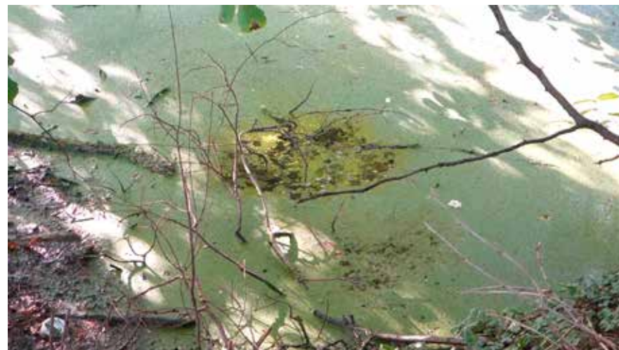
— © Christine Felten, Photogramme: Marais , vidéo HD 2015: 2'09"