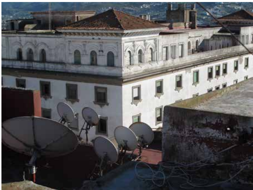
— © Christine Felten, Tétouan 2011