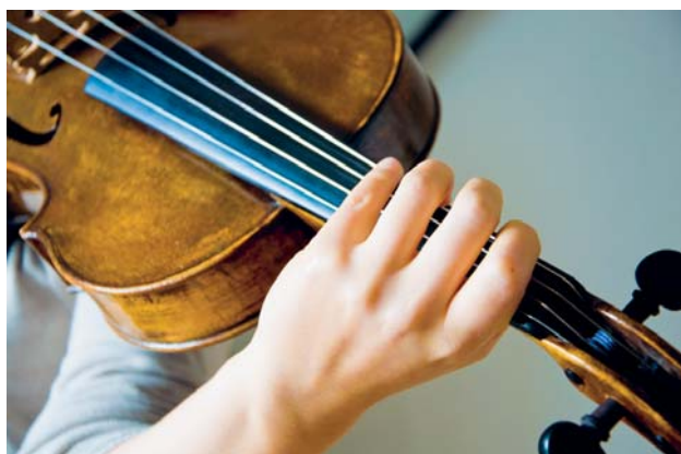
Figure 2. La main, rôle central dans la pratique instrumentale.